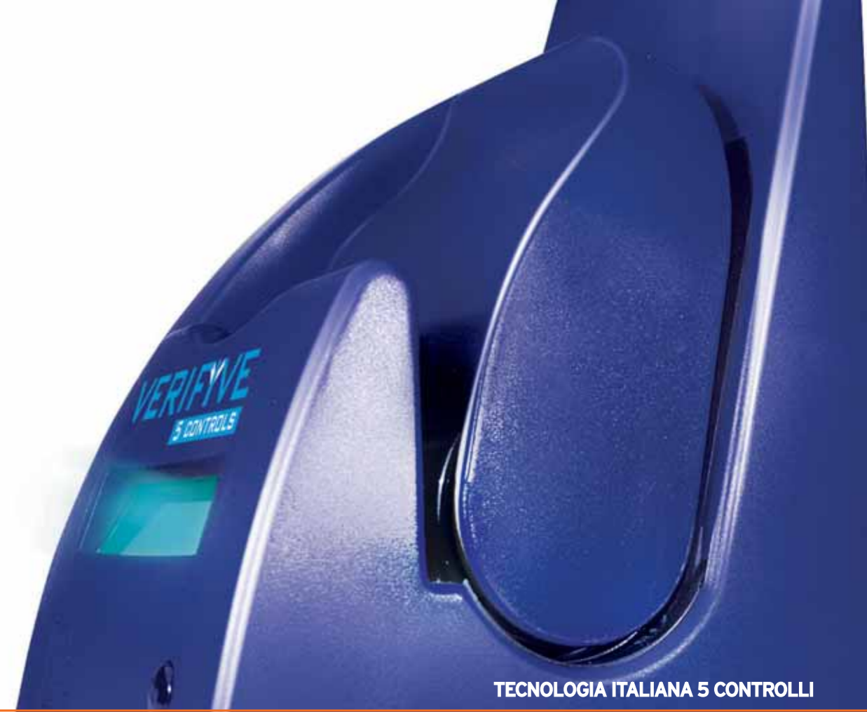
TECNOLOGIA ITALIANA 5 CONTROLLI

Photovox garantisce che Verifive è privo di difetti di fabbricazione ed è stato costruito con materiali idonei. Sono esclusi da garanzia i danni causati da incidente, uso improprio, abuso, esposizione a liquidi, calore ed umidità, campi magnetici intensi, cause ambientali esterne, alimentazione non idonea o diversa da quella consigliata. La garanzia è valida 24 mesi. Per le modalità di applicazione della garanzia, rivolgetevi al vostro Rivenditore o direttamente alla Photovox, servizio di assistenza commerciale +39 0124 653811 e-mail: photovox@photovox.it o direttamente dal sito www.photovox.it