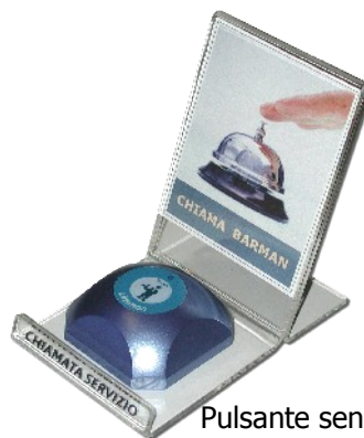
Pulsante senza fili con stand segnaposto "personalizzabile"